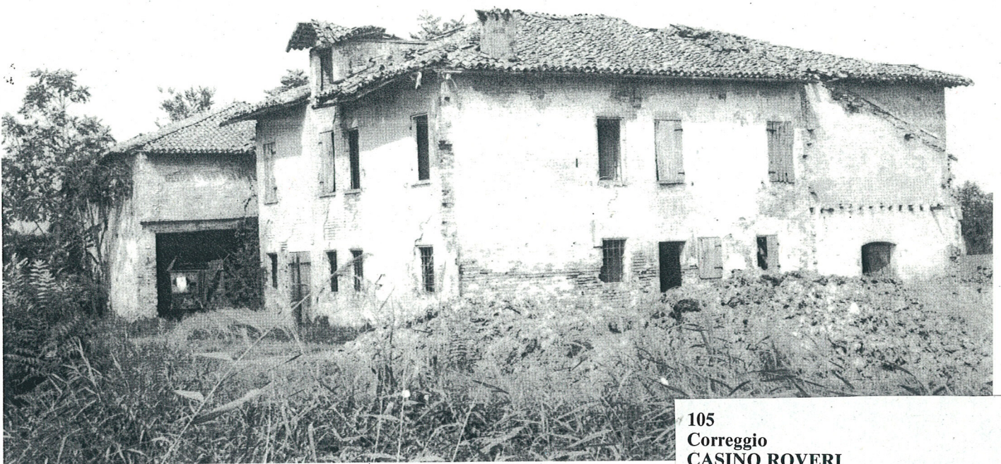
Casinò Roveri, 105.