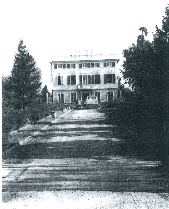
Via Lemizzone. Casino, 220.