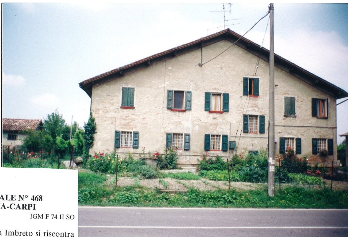
195 Correggio STRADA STATALE N° 468 REGGIO EMILIA-CARPI alt. m. - IGM F 74 II SO