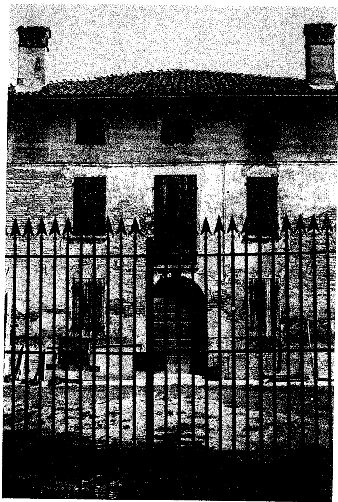
Via dell'Apicoltore / Catini. Complesso rurale a corte, 202.

te. Al centro si lume a pianta itazione dispo- totetto, con co- l'ingresso è ar- co da una porta nta a sud verso i recinzione con fastigi a pigna e enza dell'ingres- n ferro battuto. via Strega si os- su tre piani con e. La costruzio- a articolata; i li- cordolo marca- rate da cornici. ell'ingresso, al un balcone ba- ilastrini con ba-