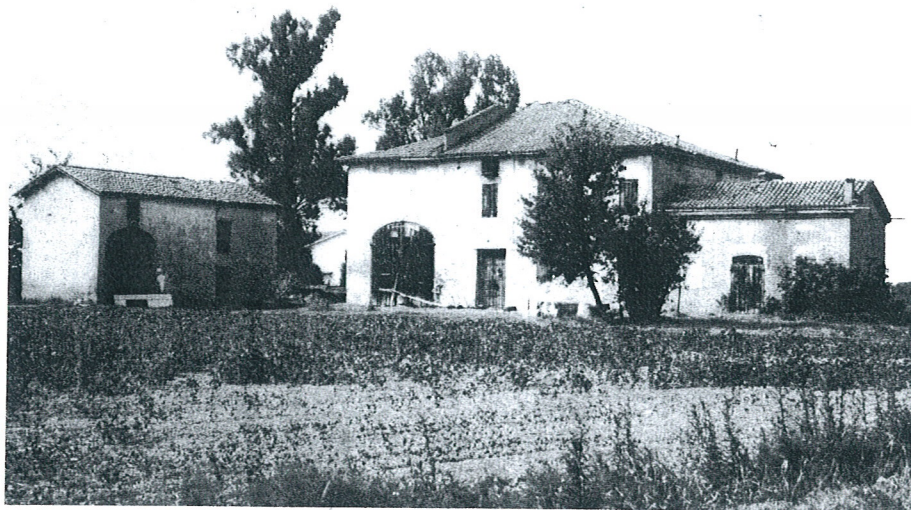
C. Villa. Complesso rurale, 81.

Di fronte alla C. Villa, sul lato di levante della strada, è osservabile un edificio rurale ad elementi giustapposti in linea con porta morta a sesto ribassato, orientato in direzione est-ovest; la copertura è a quattro falde a colmo costante. Il civile situato a ponente, ha luci regolari e simmetricamente distribuite: gli è congiunto un basso servizio con tetto a tre falde.